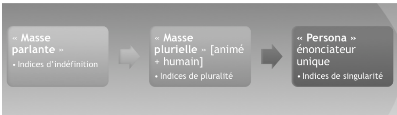
Schéma 1. Gradation : images du tiers-parlant

Cette typologie est dynamique : on remarque une gradation entre les trois types proposés, qui va de l'indéfinition à la singularité, dans un esprit très « grammairien » (cette évolution de l'indéfini au singulier est celle de l'article, par exemple). Dans le premier cas, impossibilité d'identifier une source énonciative, définissable uniquement par son indéfinition même ; dans le second pluralité comme ensemble d'éléments identifiables mis ensemble et saisis comme groupe ; dans le troisième, singularité de la parole d'un sujet énonciateur unique. On peut figurer ce dynamisme dans le schéma suivant :