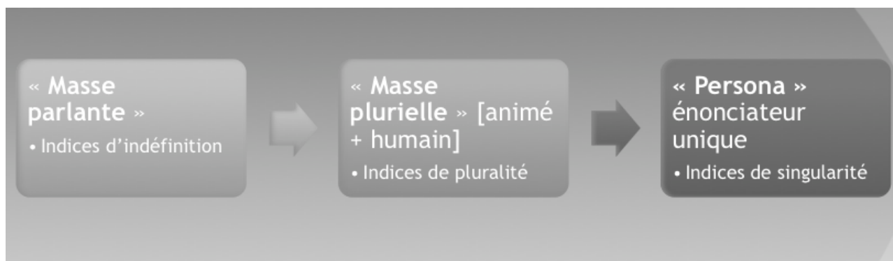
Schéma 1. Gradation : images du tiers-parlant

Cette typologie est dynamique : on remarque une gradation entre les trois types proposés, qui va de l'indéfinition à la singularité, dans un esprit très « grammairien » (cette évolution de l'indéfini au singulier est celle de l'article, par exemple). Dans le premier cas, impossibilité d'identifier une source énonciative, définissable uniquement par son indéfinition même ; dans le second pluralité comme ensemble d'éléments identifiables mis ensemble et saisis comme groupe ; dans le troisième, singularité de la parole d'un sujet énonciateur unique. On peut figurer ce dynamisme dans le schéma suivant :