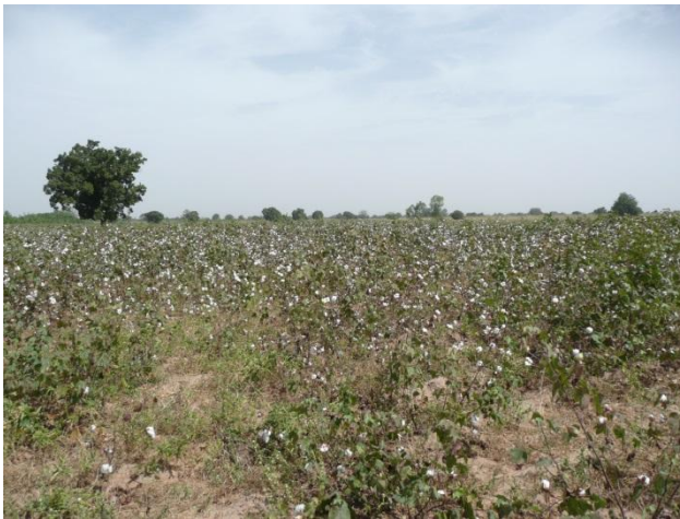
Fig. 3 : Champ de coton et savane dégradée à TOROZUGOU commune de Malanville

plus souvent, c'est la disponibilité limitée de terre fertile qui conduit les paysans à compter de plus en plus sur les terres marginales pour leur production agricole. Ainsi à Podo la pression de la population croissante (car Podo est situé à moins de 10 kilomètres à l'est de Kandi) amène-t-elle à la recherche de terres. Mais c'est difficile car un champ d'un hectare vaut 5000 F CFA à la location en 2009, bien trop cher pour en louer d'autres... qui de toute façon manquent. C'est pourquoi dans les bas-fonds de la région, on trouve une réalisation du président Yayi Boni pour convertir de nouvelles terres en rizières. Il en est de même à Torozougou (fig. 3) où les villageois manifestent une grande « soif » de terre : la population a beaucoup augmenté ainsi que la taille des troupeaux. Parmi les exemples de terres trop sollicitées face au manque de terroirs, un « vieux » paysan nous a expliqué qu'un de ses champs dans lequel il a planté du coton, est cultivé sans repos depuis 47 ans. Sur ces sols, il est nécessaire de pratiquer la rotation des cultures, sinon les sols se fatiguent : le coton, en particulier, épuise la terre.