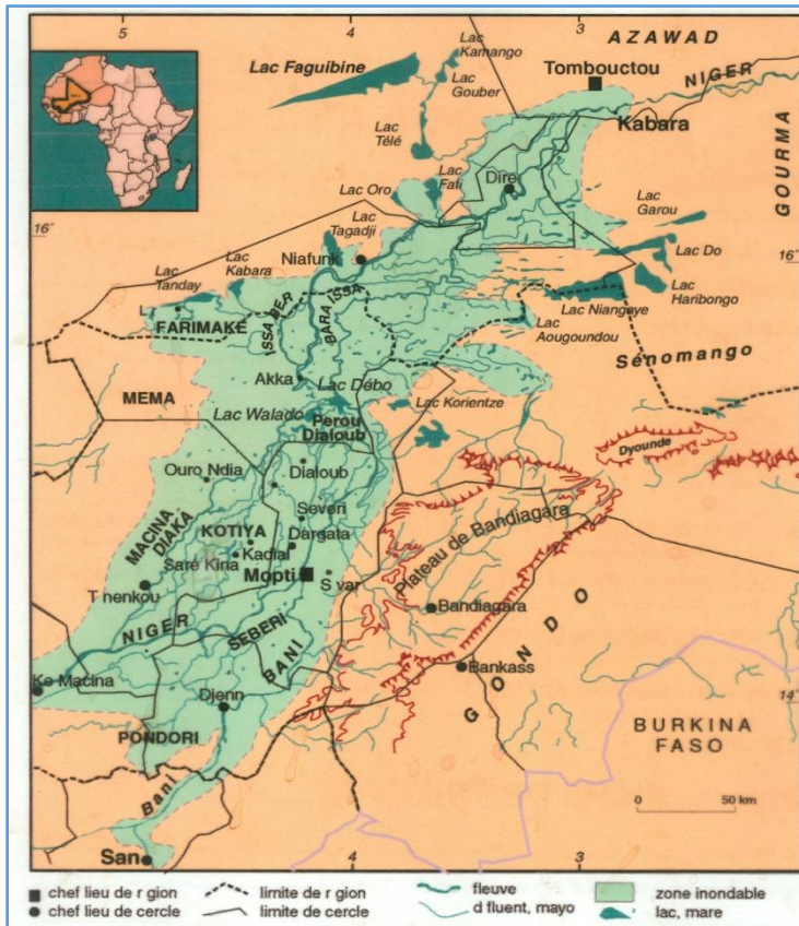
Figure 1 : Le Delta Intérieur du Niger

Cellule d'Appui à la Décentralisation et à la Déconcentration Elevage et Pêche. Bamako (Mali)