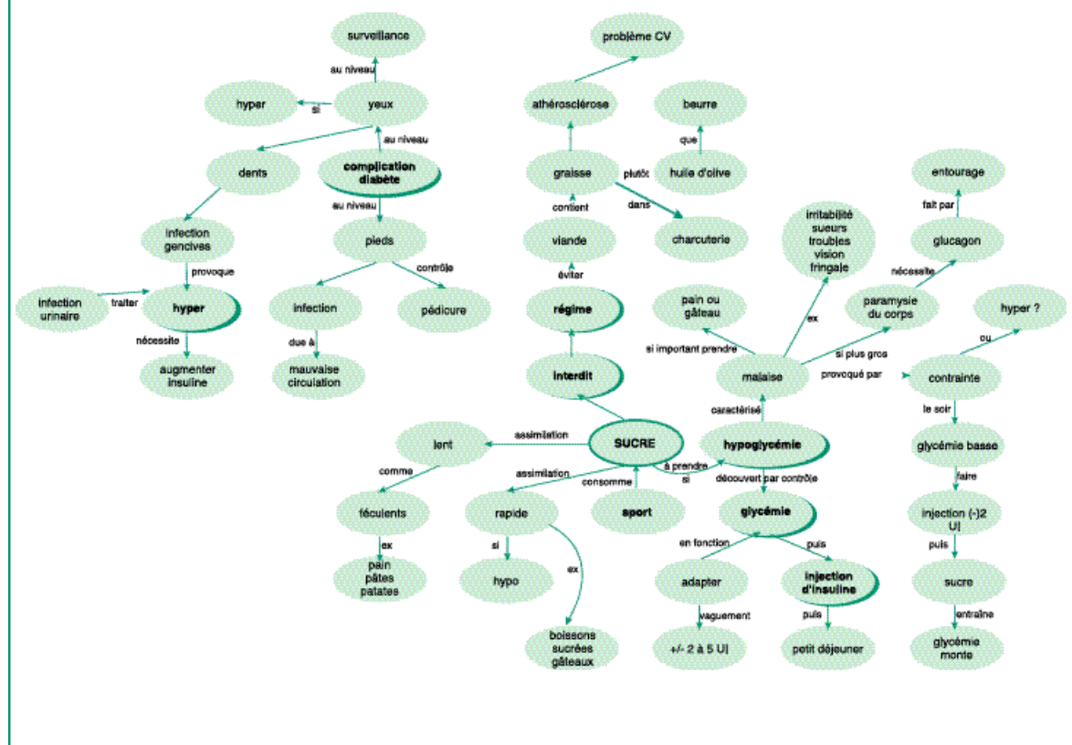
Figure 2 : Extrait d'une carte conceptuelle élaborée au cours d'un entretien avec une patiente diabétique

Le même type d'étude a été menée auprès d'enfants diabétiques âgés de 8 à 13 ans, démontrant la faisabilité et l'intérêt à utiliser des cartes conceptuelles avec ce public particulier 50,51 . De mêmes, les cartes conceptuelles ont été employées pour évaluer un programme d'éducation nutritionnelle auprès de patients en surpoids. Les auteurs ont, par ailleurs, mis en lien les informations obtenues dans les cartes conceptuelles avec les résultats de tests psychologiques administrés aux patients 52 . Une autre recherche menée auprès de patients obèses a confirmé l'intérêt diagnostique des cartes conceptuelles en cherchant à repérer dans les cartes conceptuelles des caractéristiques cognitives propres aux patients « normo-évaluateurs » et aux patients « sous-évaluateurs » de leurs apports alimentaires 53 . D'autres études sont actuellement en cours au sein du Laboratoire de Pédagogie de la Santé de l'Université Paris 13, dont l'un des axes de recherche porte sur l'éducation thérapeutique.