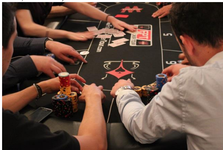
Figure 1. Des joueurs de poker lors d'un tournoi organisé en France (photographie A. Brody à Paris, mai 2011)

Comme chacun sait, le poker est un jeu de cartes qui se pratique avec de l'argent. Précisément, il s'agit de miser sur une combinaison de cinq cartes distribuées au hasard à chacun des joueurs de la table. Si le poker est donc un jeu d'argent et de hasard, il comprend néanmoins une part de stratégie puisque les joueurs peuvent s'attribuer l'argent du pot sans forcément