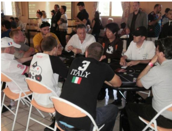
Figure 10. Un joueur de poker français avec un maillot de l'Italie (photographie A. Brody à Tours, avril 2011)

Au sens de Lave et Wenger (1991), une « communauté de pratique » se définit par le mode de socialisation de ses membres via l'apprentissage de la pratique qu'ils ont en commun. Ce processus d'apprentissage par lequel de nouveaux venus intègrent la communauté suppose une participation progressive aux pratiques de la communauté. Selon Lave et Wenger, c'est en passant d'une « participation périphérique légitime » à une « pleine participation », que les nouveaux venus deviendront à leur tour membres de la communauté de pratique en question. Si les joueurs de poker et les parieurs sportifs n'appartiennent pas, à proprement parler, à la même communauté de pratique (au singulier), il existe bien une certaine communauté de pratiques (au pluriel) entre ces jeunes joueurs que nous avons rencontrés en France et en Italie. En effet, tous ont en commun de s'être progressivement engagés dans la pratique d'un jeu d'argent mêlant hasard et stratégie. Outre l'intérêt commun qu'ils portent à ce type de jeux (rappelons que certains joueurs de poker sont aussi parieurs sportifs), ils partagent également cette même « passion ordinaire » pour le jeu qui les conduit à vouloir progresser dans leur