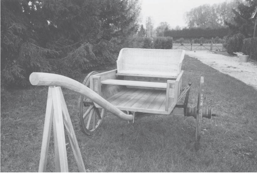
Figure 1. Essedum gallo-romain

Reconstitution M. Molin, cliché J. Valentin.