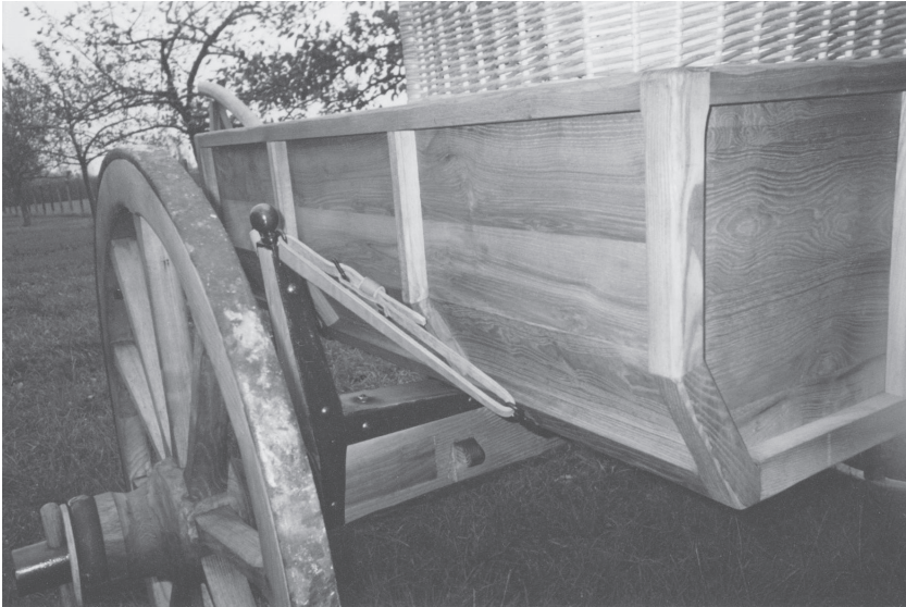
Figure 3. Essedum gallo-romain

Reconstitution M. Molin, cliché J. Valentin.