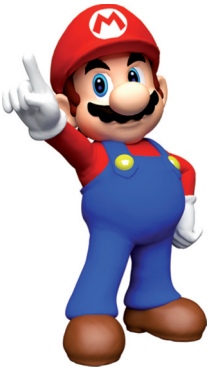
↑ Super Mario © Nintendo.

La question du loisir a été souvent l'objet de débats autour de sa contribution à l'épanouissement des individus, à leur éducation. Cette question est générale si l'on pense au livre ou au cinéma. Dans quelle mesure les supports conçus pour le loisir peuvent-ils contribuer à l'éducation ? De fait l'école s'est constamment réapproprié le monde du loisir dans un objectif éducatif, à commencer par le livre, le théâtre et d'autres pratiques comme le jeu point sur lequel nous reviendrons.