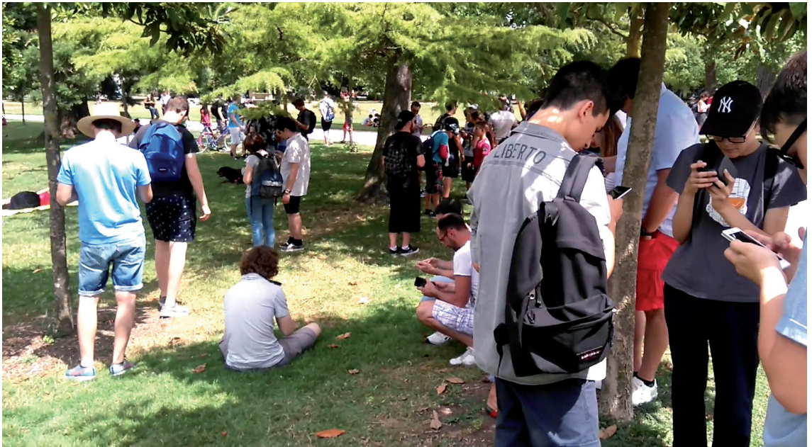
↓ Chasse au Pokémon!