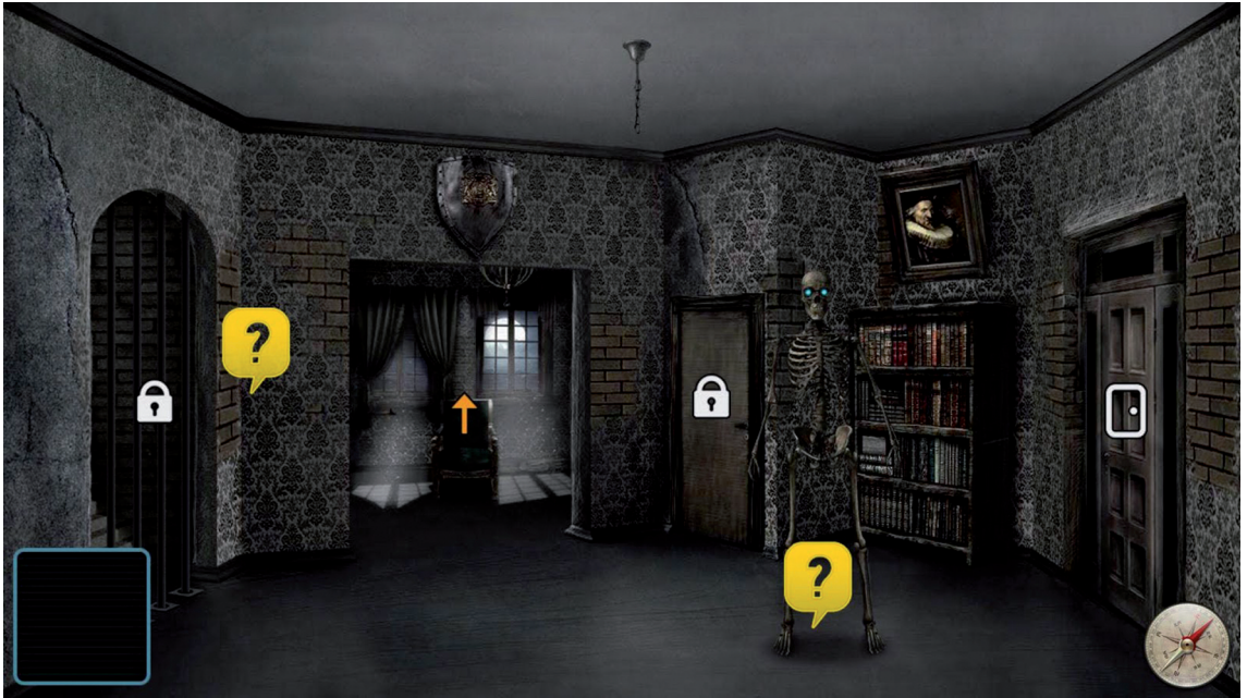
↑ Escape Game Locks Adventure.