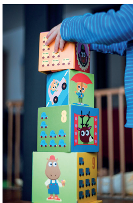
↑ Cubes à empiler Djeco, design : Édouard Manceau.

une expérience riche de divertissement (sans oublier les dimensions techniques essentielles).