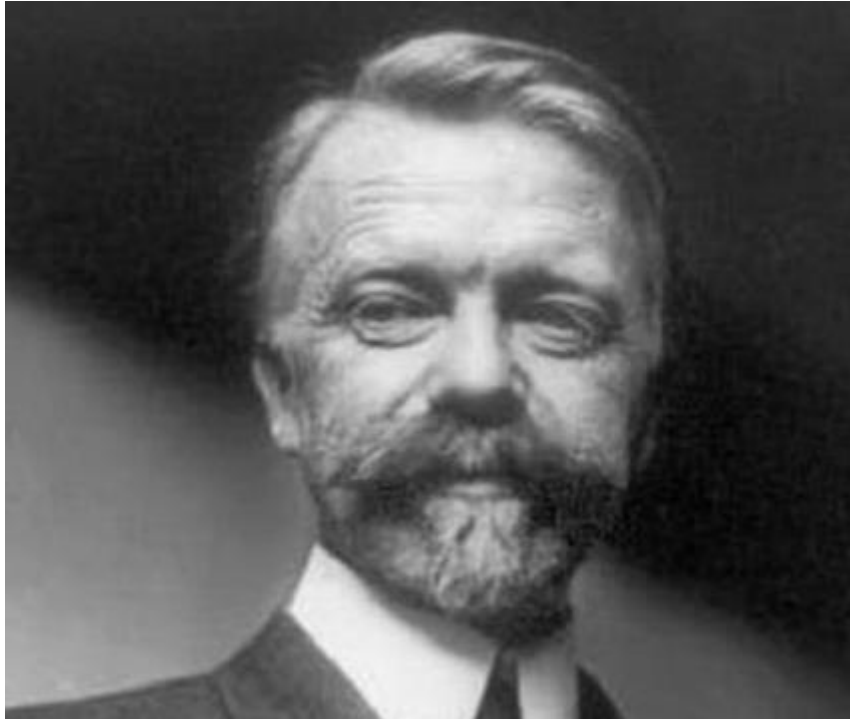
Photographie de Henri Fayol en son âge mûr.